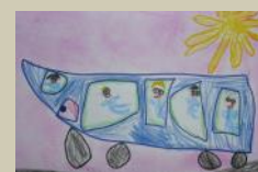
Ci portano a vedere il sito