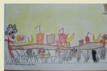
Tutti a tavola ....si