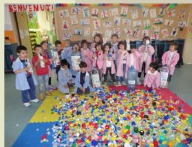
“Tappi a volontà”

Bambini sezione "B" 5 anni Ins. Fiori /Massidda/Marrocu/Floris