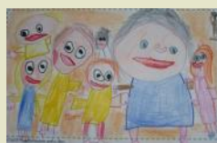
Ascoltiamo Daniela che