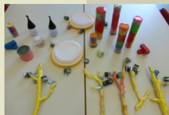
Gli strumenti realizzati.....