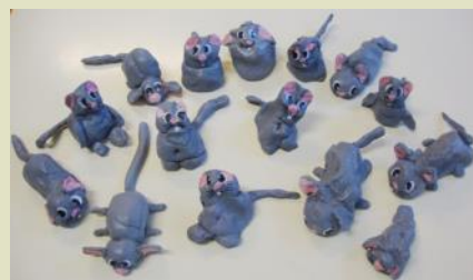
Dal racconto "Il topolino e il drago"

Le attività plastico-manuali sono state proposte in maniera trasversale ai diversi contenuti svolti nell'arco dell'anno scolastico e accolte con costante motivazione dai bambini, che, al loro primo ingresso nella scuola dell'infanzia, hanno potuto sperimentare l'utilizzo di materiali plasmabili, in particolare della pasta al sale, al fine di sviluppare competenze, quali capacità sensoriali, abilità manuali e, non ultima, la creatività. Tali attività hanno,