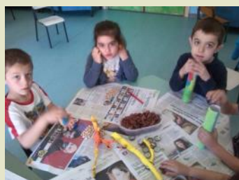
Progettiamo e costruiamo....