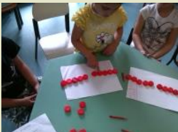
La nostra scala del dieci ....