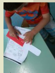
La nostra scala del

Presto andremo alla scuola primaria... in questi ultimi mesi ci siamo divertiti con tanti giochi per imparare a contare e a calcolare: con le mani, con i cerchi, con i tappi abbiamo formato le cinque. Abbiamo utilizzato la linea del 20, l'abbiamo costruita anche con le mollette e il cartoncino