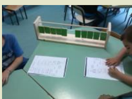
La scala del dieci ....