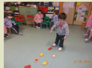
Percorso: I bambini attraversano il

Con il Laboratorio di Animazione alla Lettura ci si è posti l'obiettivo di promuovere la conoscenza tra bambini, insegnanti ed esperto esterno attraverso l'ascolto, l'utilizzo di competenze acquisite, lo stimolo di capacità di osservazione, di espressione verbale, di abilità manuali e sensoriali. Le attività a tema, presentate in forma ludica, sono state fonte di arricchimento per i