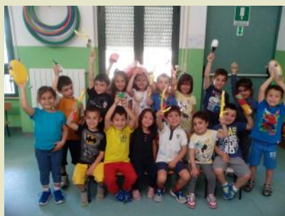
La nostra orchestra .....