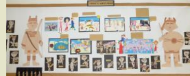
Rielaborazioni grafiche realizzate dai

Nell’ambito del progetto di plesso “Storie animate” la sezione “D” ha realizzato il laboratorio sui “Giganti di Mont’e Prama”. Le attività condotte dalle insegnanti di sezione in collaborazione con l’esperto esterno l’antropologa Susan Ecca, si sono articolate in due momenti di due giornate differenti. La prima alla scoperta dei giganti e la raccolta di informazioni circa la loro storia attraverso la visita guidata al museo di Cabras e al sito di Mont’e Prama. La seconda, realizzata in classe, i bambini sempre guidati dall’esperto, dopo aver recuperato, attraverso una caccia al tesoro, gli elementi/informazioni fondamentali relative alla giornata trascorsa nel Sinis, hanno inventato, tra realtà e fantasia, una storia. Successivamente il percorso è stato rielaborato a livello