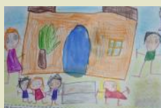
...entriamo al Museo di