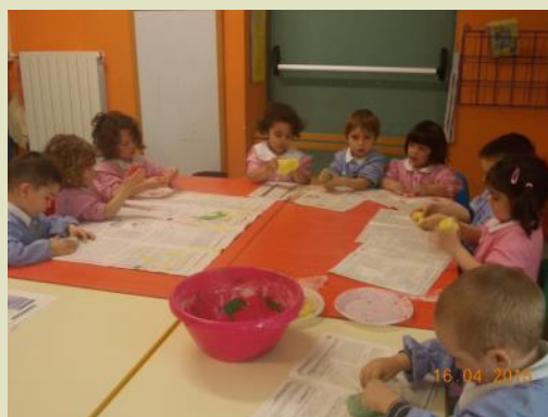
Realizziamo gli elementi.....