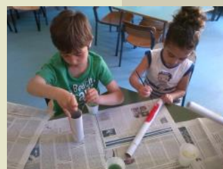
Progettiamo e costruiamo....