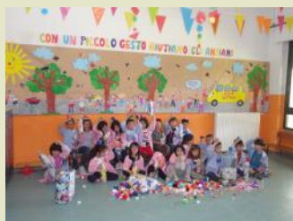
Il pannello murale dedicato

L'iniziativa che si ripete nella scuola di via Lanusei da diversi anni, ha coinvolto tutte le famiglie dei bambini iscritti. Dopo aver sensibilizzato tutti sul problema del trasporto in sicurezza degli anziani, è iniziata la gara di solidarietà.... Il ricavato dell'iniziativa contribuirà all'acquisto di un pullmino a favore dell'associazione. I bambini hanno realizzato un pannello murale con attività grafiche pittoriche di gruppo.