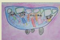
Si parte ...tutti sul