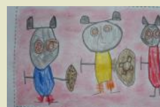
...bellissimi Giganti di