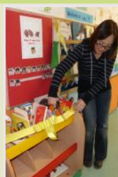
Il taglio del nastro....