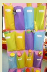
La tasca porta strumenti....