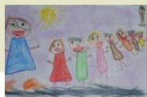
Andiamo insieme a