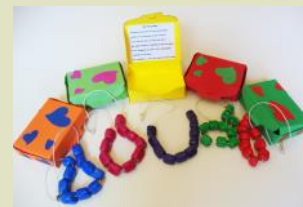
Le collane per la festa della