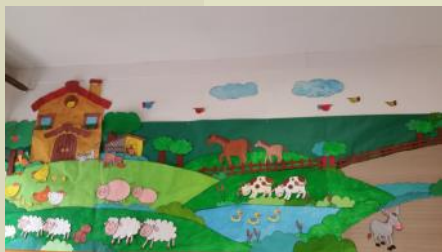
Il pannello murale della nostra sezione....

Bambini sezione “G” 4/5 anni Ins. Piredda R. / Concu