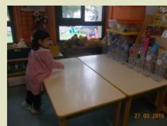
Su indicazione dell'insegnante i bambini devono colpire le bottiglie di uno specifi-