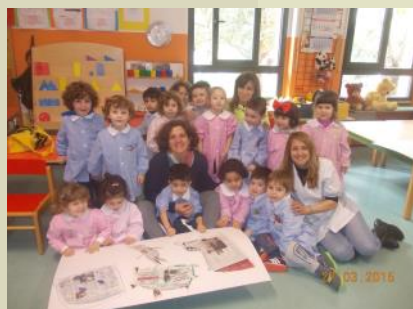
Foto di gruppo con l'esperta