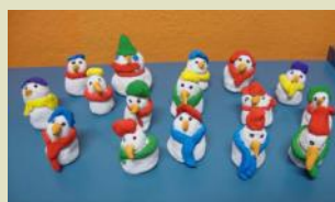
I pupazzetti di neve ...