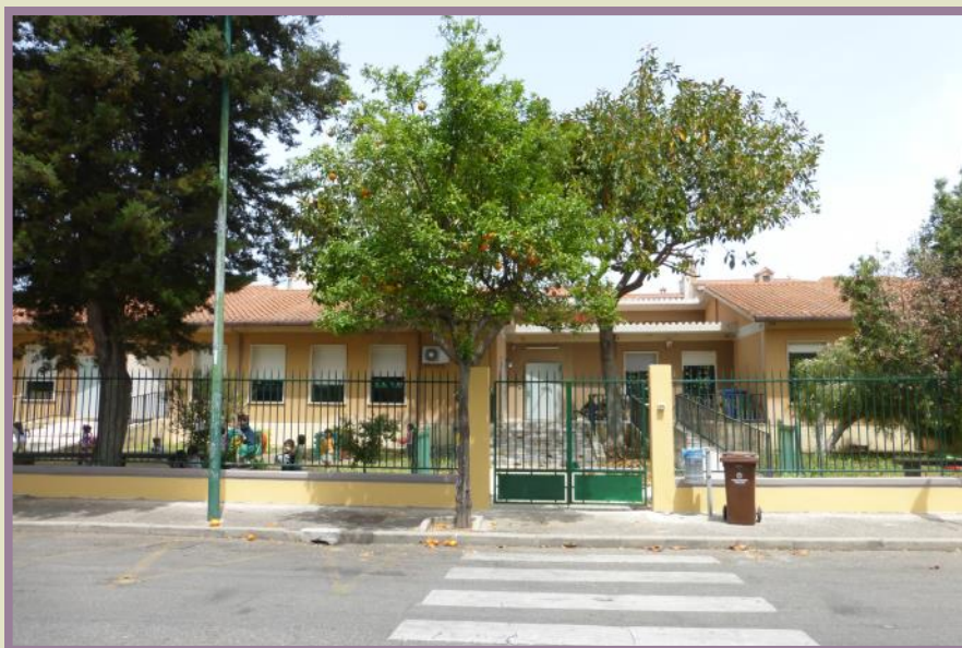
La nostra scuola