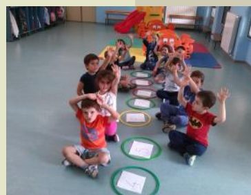
Contiamo con i cerchi ....