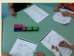
La scala del venti....

Presto andremo alla scuola primaria... in questi ultimi mesi ci siamo divertiti con tanti giochi per imparare a contare e a calcolare: con le mani, con i cerchi, con i tappi abbiamo formato le cinque. Abbiamo utilizzato la linea del 20, l'abbiamo costruita anche con le mollette e il cartoncino