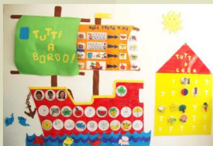
Saliamo a bordo...

La nave "Tutti a bordo", che metaforicamente accoglie insegnanti e bambini nel loro viaggio di "condivisione", "ricerca" e "scoperta", è stata predisposta per la registrazione delle presenze e di semplici compiti. I bambini, all'ingresso a scuola, sistemando il proprio contrassegno nel posto assegnato, si appropriano di pratiche quotidiane quali fare l'"appello" e svolgere incarichi, importanti per l'iniziale ambientamento, l'assunzione di semplici responsabilità e la presa di coscienza di sé e degli altri (coetanei ed adulti). Dal ripetersi di queste routines il bambino, conoscendo il suo quotidiano, struttura